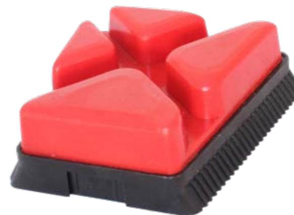
Satin finish Satinatura

RUBBER BOND FRANKFURT "STELLA" 100 X 90 / 67 X 16 GRIT 220 / 1200